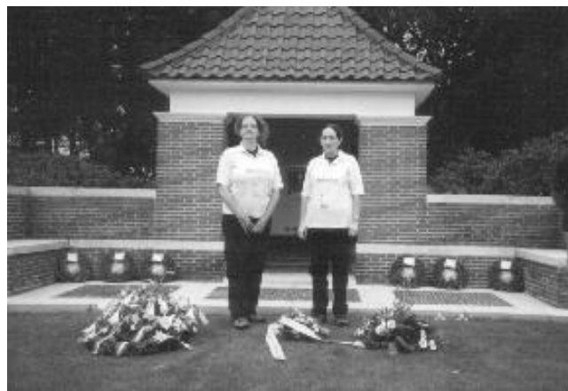
Airborne Divisie terecht kwam.

Vanaf Herberg 't Zwaantje is het de bedoeling om gezamenlijk verder te gaan, doch we zijn weer iets achter op het schema en wandelen dus in straf tempo over de heuvels van het open gebied 'Klein Amerika'. Dit was ook een van de grote landingszones waar het 505 e Para Regiment van de 52 e