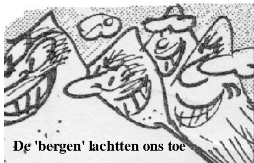
De 'bergen' lachtten ons toe

We waren nu in de Mookse en Maldense bossen. Op de Mooker Hei, die ik tijdens het Airbornepad Market Garden overgeslagen had, kwamen we helaas niet. Er zaten volgens het routeboekje, dat overigens de moeite waard was met kaartjes, kleurenfoto's en beschrijvingen van karakteristieke punten en landschappen, enkele steile klimmen in het parcours. Zo lasen we ook dat hier ergens een waterscheiding is, waar de regen in noordelijke richting in de Rijn, en in zuidelijke richting in de Maas terugvloeit.