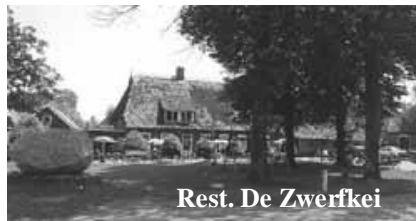
Rest. De Zwerfkei

Het kerspel was in oorsprong niet een strikt kerkelijke organisatie maar ook burgerlijk, schultambten genoemd. In 1518 is Sleen een zelfstandige schultambt. De functie van Schulte is enigszins vergelijkbaar met die van burgemeester en notaris samen. We kenden in Sleen ook de functie van bannerschulte. De schulte van Sleen was bannerschulte van het dingspil Zuidenveld.